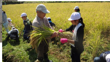
<高畠町における有機農業者が支える食農教育（和田小学校）>

本フォーラムでは、農林水産省から今後の有機農業の推進方向について講演いただくとともに、2つの町から有機農業が地域に活力をもたらした事例を紹介いただきます。