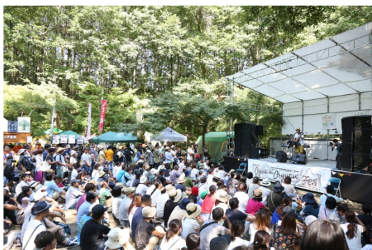
<「小川町オーガニックフェス」の様子>